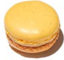
Prunelle de Troyes®