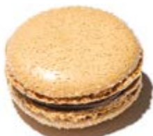
Caramel beurre salé