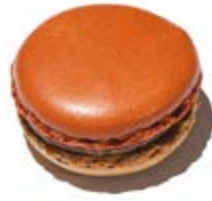
Whisky Jack Daniel's®