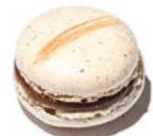
Pâte à tartiner Maison