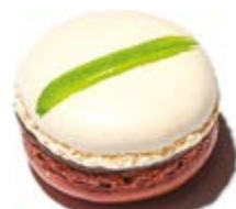
Menthe / Choco