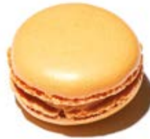
Miel / Abricot