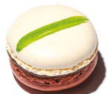
Menthe / Choco