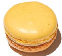
Prunelle de Troyes®