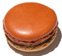
Whisky Jack Daniel's®