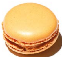
Miel / Abricot