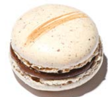
Pâte à tartiner Maison