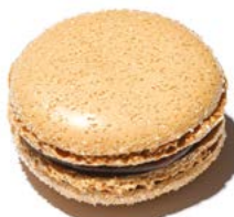
Caramel beurre salé